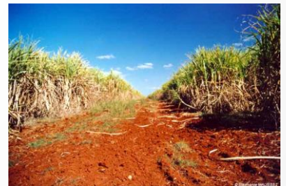
Champs de canne à sucre de Cuba; photo voyage

Cuba est connu pour sa production de cigare grâce à la culture de champs de tabac, son Rhum, ses champs de cannes a sucre, ainsi que pour sa gastronomie. Elle accueille plus de 4 millions de touristes par an.