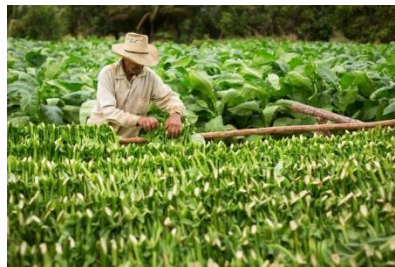
Champs de tabac à Cuba